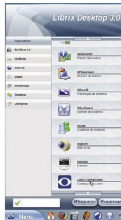
Figura 2 O aplicativo KBFx é bonito e funcional, mas pode assustar quem já se habituou ao menu padrão do KDE.