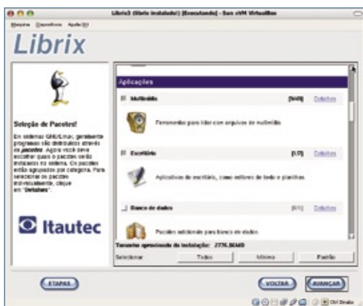
Figura 1 Há vários conjuntos de pacotes a selecionar.

Como distribuição para uso em desktops, o Librix é uma agradável surpresa após a instalação. Sua área de trabalho do KDE já vem embelezada de uma forma que tomaria de