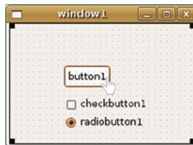
Figura 1 Elementos de uma janela.

Um sinal é uma mensagem enviada por um widget sempre que o usuário interage com ele. Diferentes widgets emitem diferentes sinais sob diferentes circunstâncias. Pode parecer complexo, mas na verdade é bastante simples. Um botão, por exemplo, emite o si-