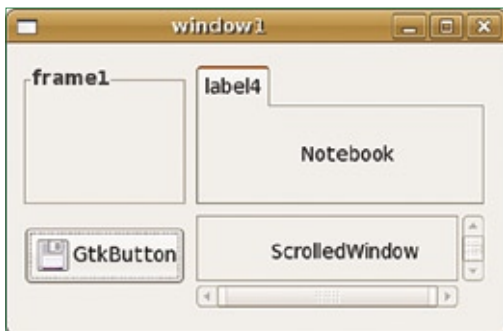
Figura 2 Contêineres são elementos especiais que podem conter outros elementos em seu interior.

No exemplo 1 , demonstramos a utilização de sinais e callbacks através de programação estruturada. Nele, construímos uma janela que pede ao usuário seu peso e altura, e quando este clica no botão calcula , o programa exibe o índice de massa corpórea no console. Note que os comandos echo e print , que na Web exibem o resultado em