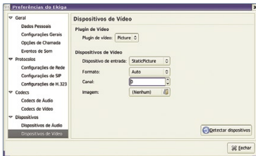
Figura 5 Configuração de uma câmera no Ekiga.

Se a operadora restringir apenas ligações de ou para outras redes em casos excepcionais, talvez seja melhor ligar para o telefone comum do usuário, e