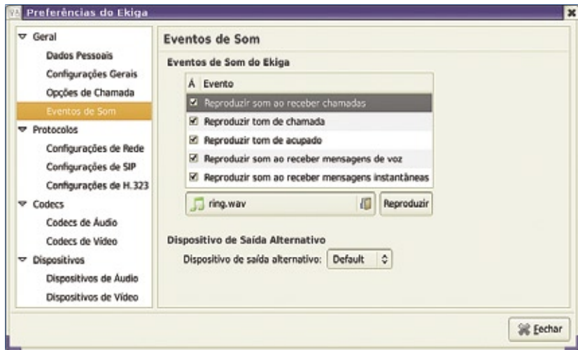
Figura 2 No Ekiga, pode-se configurar um dispositivo de toque separado.

No Ekiga, as configurações para definir o dispositivo de toque localizam-se em Geral | Eventos de Som (figura 2). Selecione o dispositivo de toque a partir da lista em Dispositivo de saída alternativo . Se nenhum