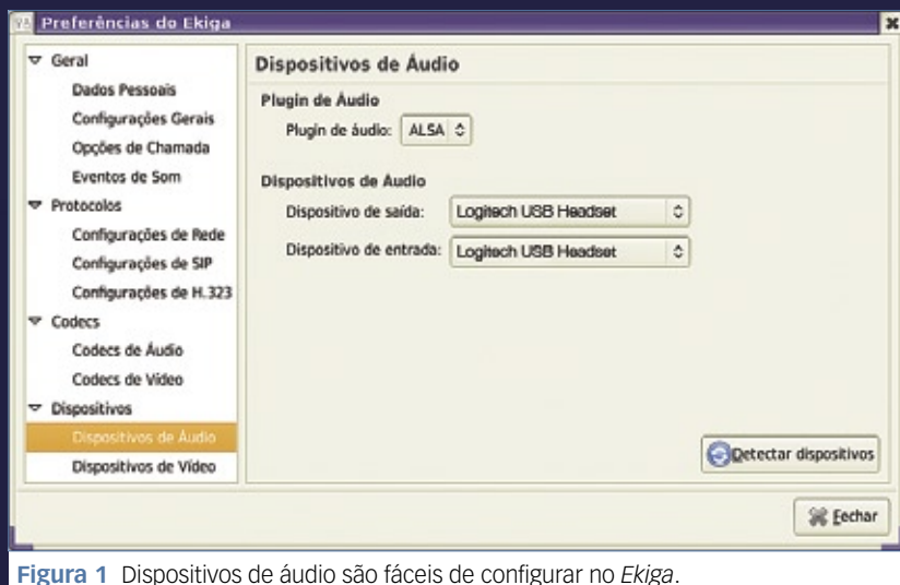
Figura 1 Dispositivos de áudio são fáceis de configurar no Ekiga.

Para isso, é necessário registrar-se com o responsável, também conhecido como