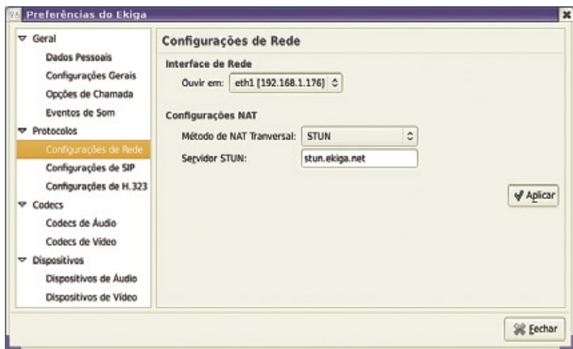
Figura 3 Um servidor STUN descobre o endereço IP de uma rede.

som for emitido ao se clicar no botão Reproduzir , pode-se tentar os dispositivos Default ou Standard .