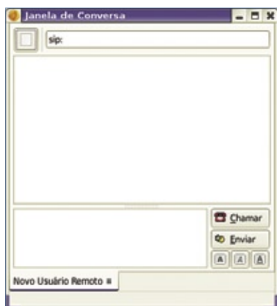
Figura 6 O Ekiga suporta conversas de texto além de voz e vídeo.

não para seu número SIP. Dependendo da operadora mudam os preços desse tipo de procedimento, mas é de se imaginar que a travessia entre os dois mundos seja mais cara que uma simples ligação por SIP — nesse caso, talvez uma ligação entre dois telefones comuns seja mais barata que uma de um SIP para um comum.