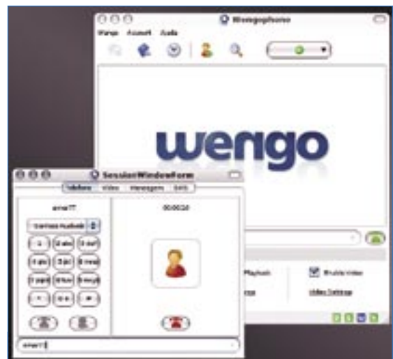
Figura 1: O OpenWengo não deve nada para as soluções proprietárias similares disponíveis no mercado.

A operação do programa é bastante intuitiva. Basta entrar o nome do usuário com quem se deseja falar no campo correspondente – ou um número de telefone comum – e pressionar o botão com a imagem de um telefone verde. Uma janela vai se abrir e mostrar o status da conexão. Quando o usuário atender do outro lado, uma indicação do tempo de conexão será mostrada. ➔