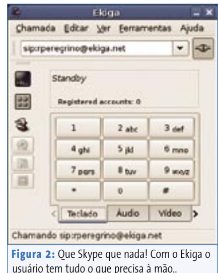
Figura 2: Que Skype que nada! Com o Ekiga o usuário tem tudo o que precisa à mão..

Apesar de já estar disponível para a plataforma de desenvolvimento Maemo do Nokia 770 Internet Tablet , a análise do sistema fugiria ao escopo deste artigo, de modo que pretendemos dedicar um artigo específico para a sua configuração em uma edição futura da Linux Magazine .