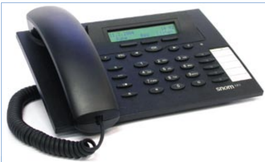
Figura 1: Os aparelhos VoIP de hoje têm recursos bastante convenientes – um deles é o visual, idêntico ao de um aparelho comum, além de display com várias linhas e teclas programáveis.

exten => _0.,1,Dial(SIP/2 ${EXTEN:1}@ProvedorVoIP)