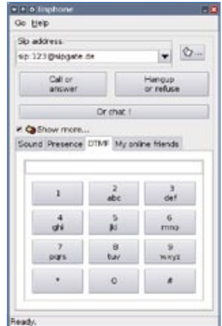
Figura 2: Uma alternativa ao aparelho VoIP é o uso de um softphone , ou telefone via software (como o Linphone ), desde que o computador tenha placa de som e um headset.

01 nonumber 02 [general] 03 port = 5060 04 bindaddr = 0.0.0.0 05 disallow=all 06 allow=ulaw 07 allow=alaw 08 maxexpirey=3600 09 defaultexpirey=120 10 context=default 11 language=pt (br) 12 13 register => 5552XXX:senha@provedorexemplo.com.br/5552XXX 14 15 [provedorexemplo] 16 type=peer 17 secret=SENHA 18 username=5552XXX 19 host=provedorexemplo.com.br 20 fromuser=5552XXX 21 fromdomain=provedorexemplo.com.br 22 insecure=very 23 24 [2000] 25 type=friend 26 secret=Senha 27 mailbox=100 28 canreinvite=yes 29 context=default 30 insecure=very 31 host=dynamic