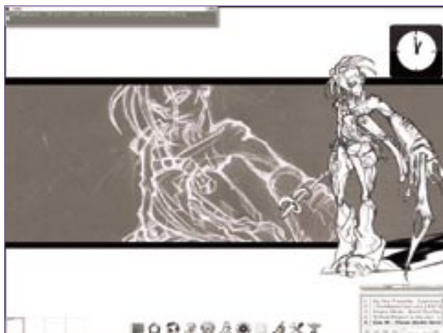
Figura 3: A interface gráfica Enlightenment E17 está disponível para download no fouiny_repo , um dos repositórios de usuários do Arch, ou AUR (Arch User Repositories).

Na seção de repositórios, é possível defini-los tanto diretamente quanto “chamar” outro arquivo. Essa última opção é útil para os repositórios oficiais, que contam com muitos espelhos, conforme exemplifica a listagem 3 .