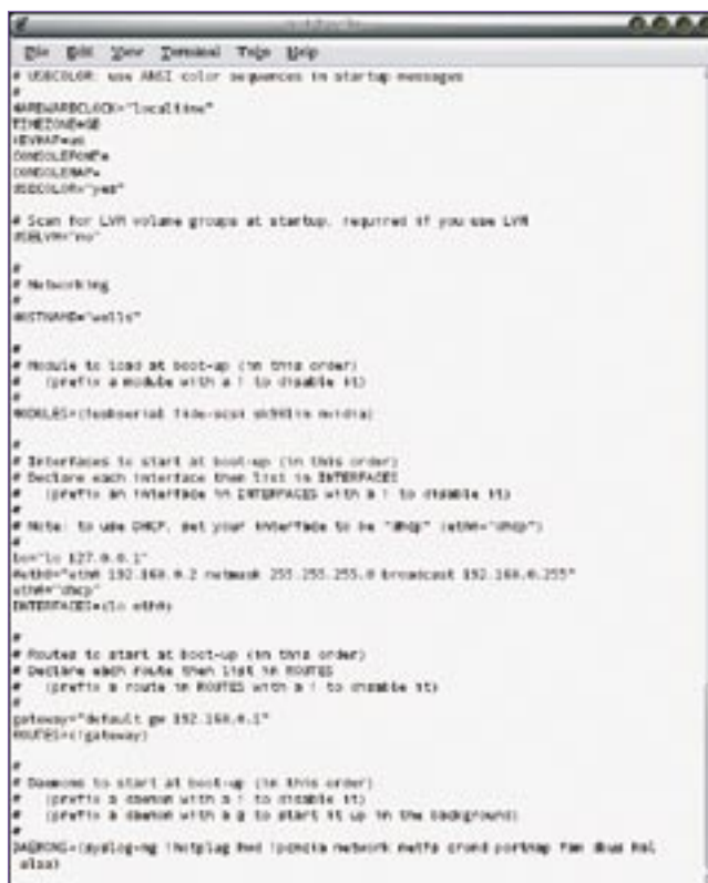
Figura 1: É preciso configurar todo o sistema editando os bons e velhos arquivos de configuração.

Como há poucas ferramentas de configuração, esse não é um sistema para usuários iniciantes. A filosofia do Arch é manter o usuário bem próximo da estrutura interna da distribuição. É necessário manipular diretamente arquivos de configuração, como nos “bons e velhos tempos”. Há vantagens nítidas sobre outras distribuições “simples”, como o Slackware. Por exem-