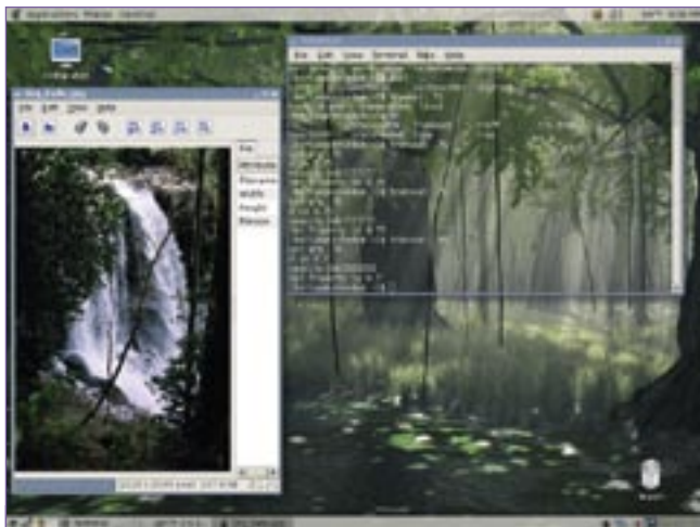
Figura 2: Embora o foco do Arch seja a configuração manual, depois que isso é feito, o sistema torna-se tão confortável quanto qualquer outra distribuição com Gnome ou KDE .

Se você escolheu o udev no lugar do devfs , não haverá problema nenhuma com esse tipo de atualização. Já, se escolheu devfs , serão necessárias etapas adicionais para converter o sistema devfs para udev .