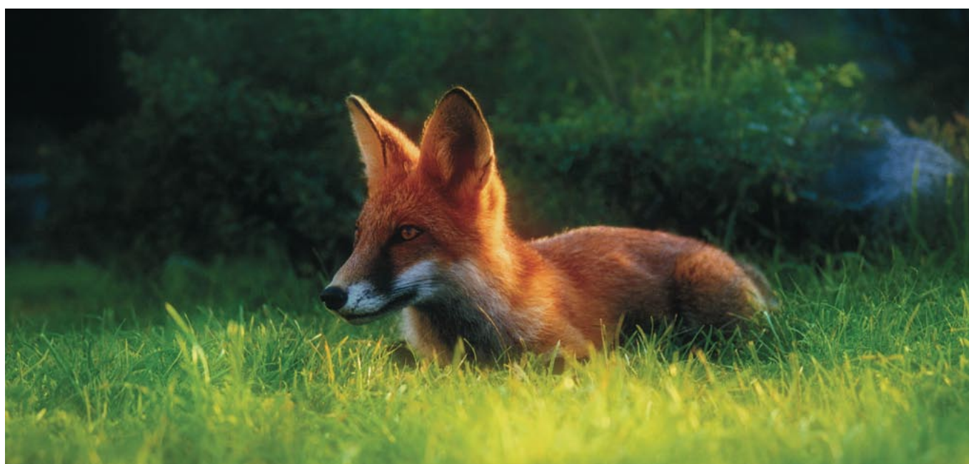
Tom Kolby: www.src.hu

Desde o fim da guerra dos browsers, em 1998, um navegador de Internet não chama tanto a atenção do público. Saiba mais sobre o Firefox e descubra o porquê. POR RAFAEL RIGUES