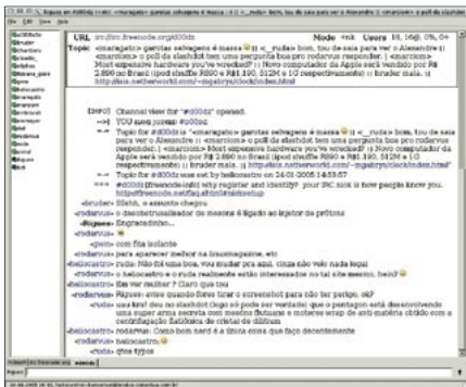
Figura 1: Chatzilla, um cliente IRC para o Firefox.

ciona com alguns derivados do Mozilla como o Galeon, o Epiphany (ambos para Linux) e o K-Meleon (para Windows). Tem apenas 271 KB e a interface pode ser personalizada com o uso de motifs (motivos), que alteram a aparência do texto e adicionam imagens de fundo, emoticons e outros itens às conversas. Um FAQ [2] tira as principais dúvidas relativas ao uso do programa.